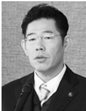
鈴木健一伊勢市長

昨年を振り返ると、元旦には、能登半島地震、9月には、同じ能登半島での豪雨による甚大な被害に、深く心を痛めた。また、8月には日向灘を震源とする地震により、初めて気象庁から「南海トラフ地震 臨時情報」の発表があった。