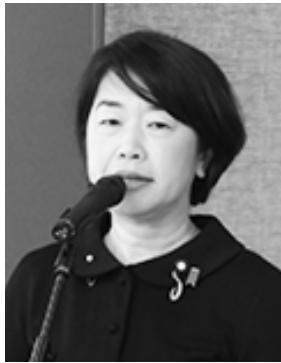
山本さちこ参議院議員