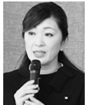
吉川ゆうみ参議院議員